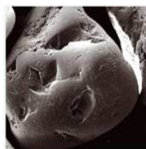
La arena con sus grietas acumula el bio-film produciéndose la contaminación biológica.